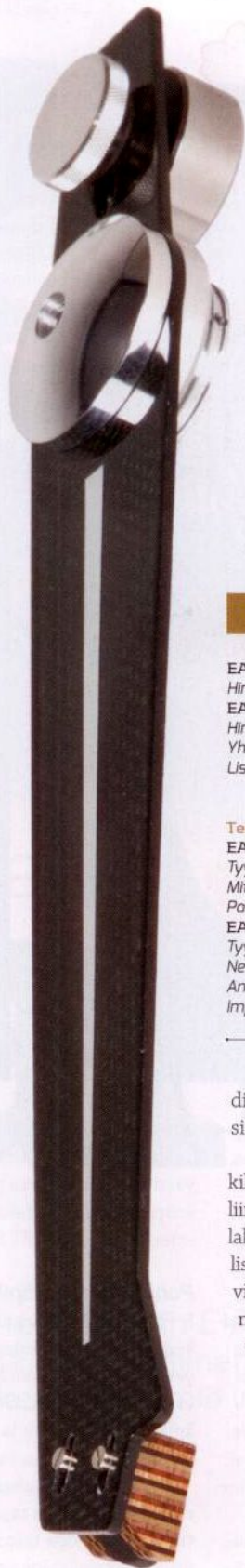
Äänivarren alapinnalla kulkeva kaapeli on kiinnitetty teipillä.

EAT E-Flat Yosegi-rasiilla osoittautui yhdistelmäksi, joka riittäisi vallan mainiosti esimerkiksi meikäläisen musiikistanautiskeluvälineeksi. Toki vastaavalla panostuksella saa muitakin varteenotettavia vaihtoehtoja. Paremmen luokan levysoittimistahan alkaa olla jo runsauden pulaa täällä Suomessakin. Löytyy Avidia, Kuzmaa, Baueria, Brinkmania, Luxmania, Oraclea, järeämpää Regaa, Michelliä, Well Temperediä, Clearaudio-ta ja SME:tä, joten tiukkaan kilpailutilanteeseen EAT saa varautua. Sama koskee toki myös Yosegia, jolla on kuitenkin edellytyksiä tasavertaiseen kisaan hintaluokkansa valitoiden kanssa. Ja vähän kalliimpienkin.